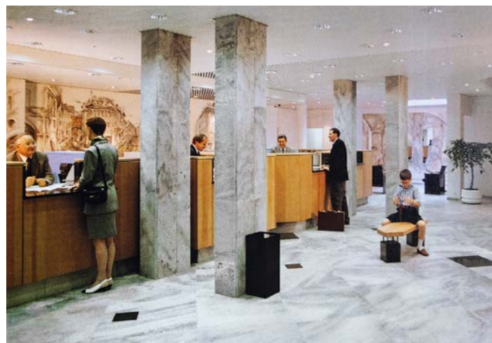
Impressionen aus der Schalterhalle der Einwohner-Ersparniskasse im Jahr 1990

Anfang 1959 wurden die umgebauten Büroräumlichkeiten und die vergrösserte Schalterhalle der Einwohner-Ersparniskasse eingeweiht. Der monatelange Umbau unter Aufrechterhaltung des Betriebes muss für die Angestellten eine enorme Herausforderung gewesen sein. Das Resultat fiel für den Verwaltungsrat «zur vollen Zufriedenheit» aus. Im Kern ist die heutige Schalterhalle das Ergebnis der damaligen Umbauarbeiten.