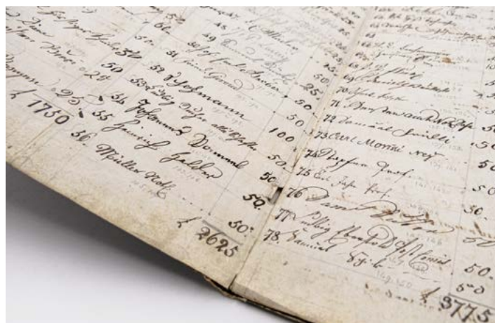
Auszug aus einem der ersten «Cassabücher» (1823) der Einwohner-Ersparniskasse